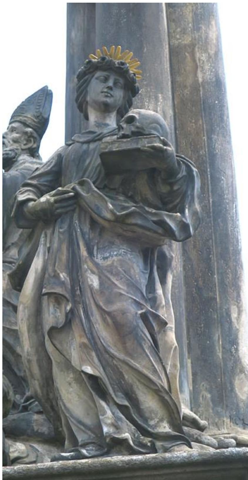
Kroměříž, sloup Nejsvětější Trojice, 2018 Socha sv. Rozálie - stav před restaurováním.