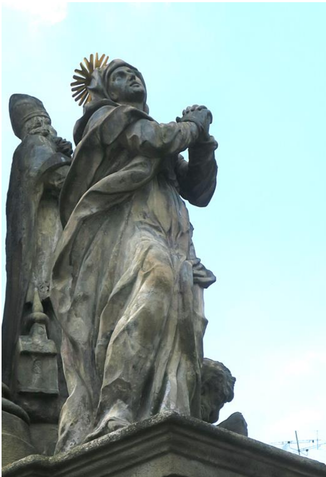
Kroměříž, sloup Nejsvětější Trojice, 2018 Socha sv. Anny - stav před restaurováním.