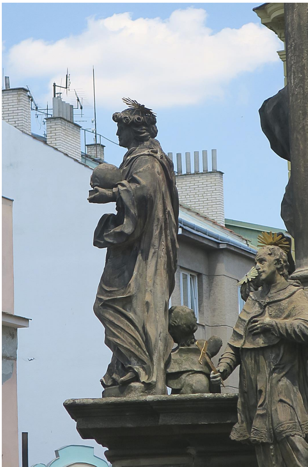
Kroměříž, sloup Nejsvětější Trojice, 2018

Socha sv. Rozálie vpravo na krycí římse soklu. Stav před zahájením restaurování.