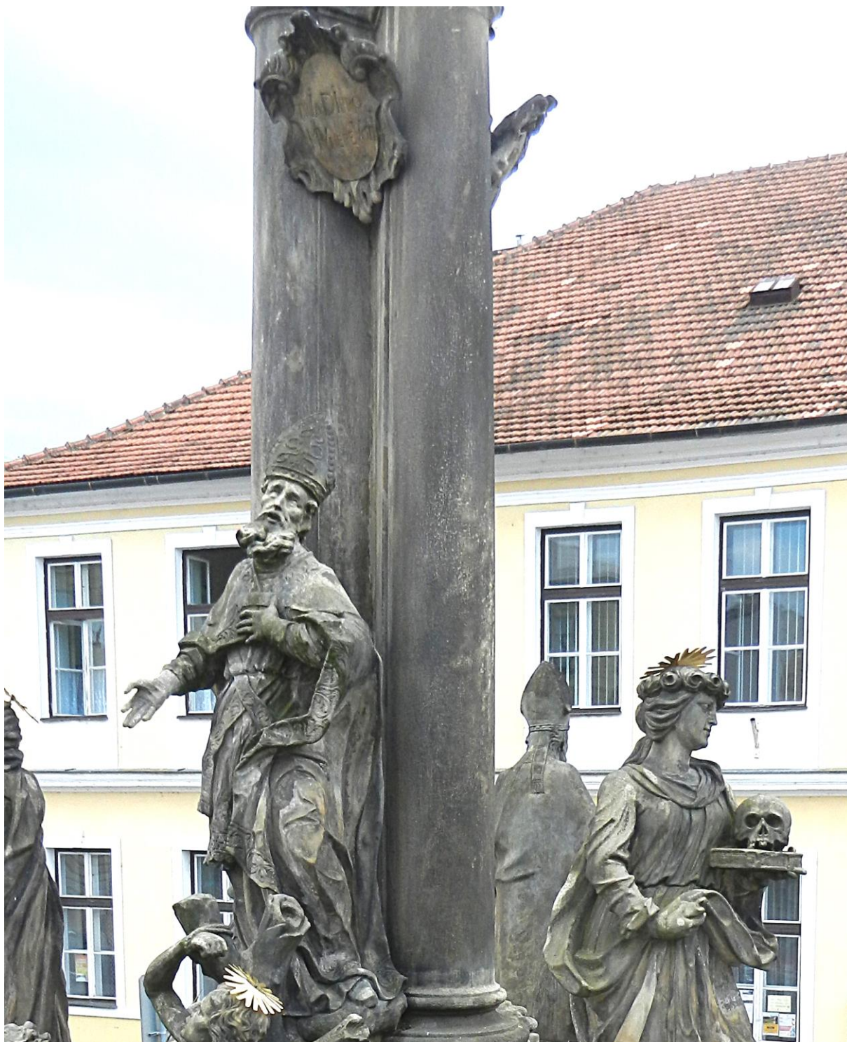
Kroměříž, sloup Nejsvětější Trojice, 2018

Čelní strana sloupu s kartuší, zavěšenou nad sochou sv. Wolfganga.