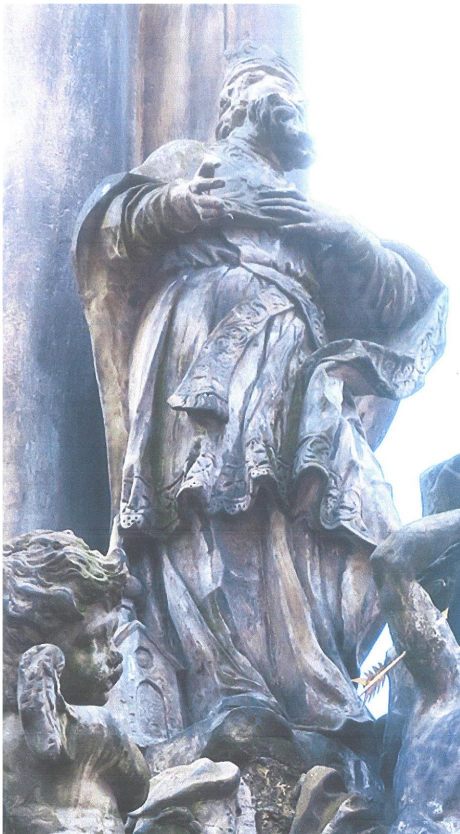
Kroměříž, sloup Nejsvětější Trojice, 2018 Socha sv. Wolfganga - stav před restaurováním.