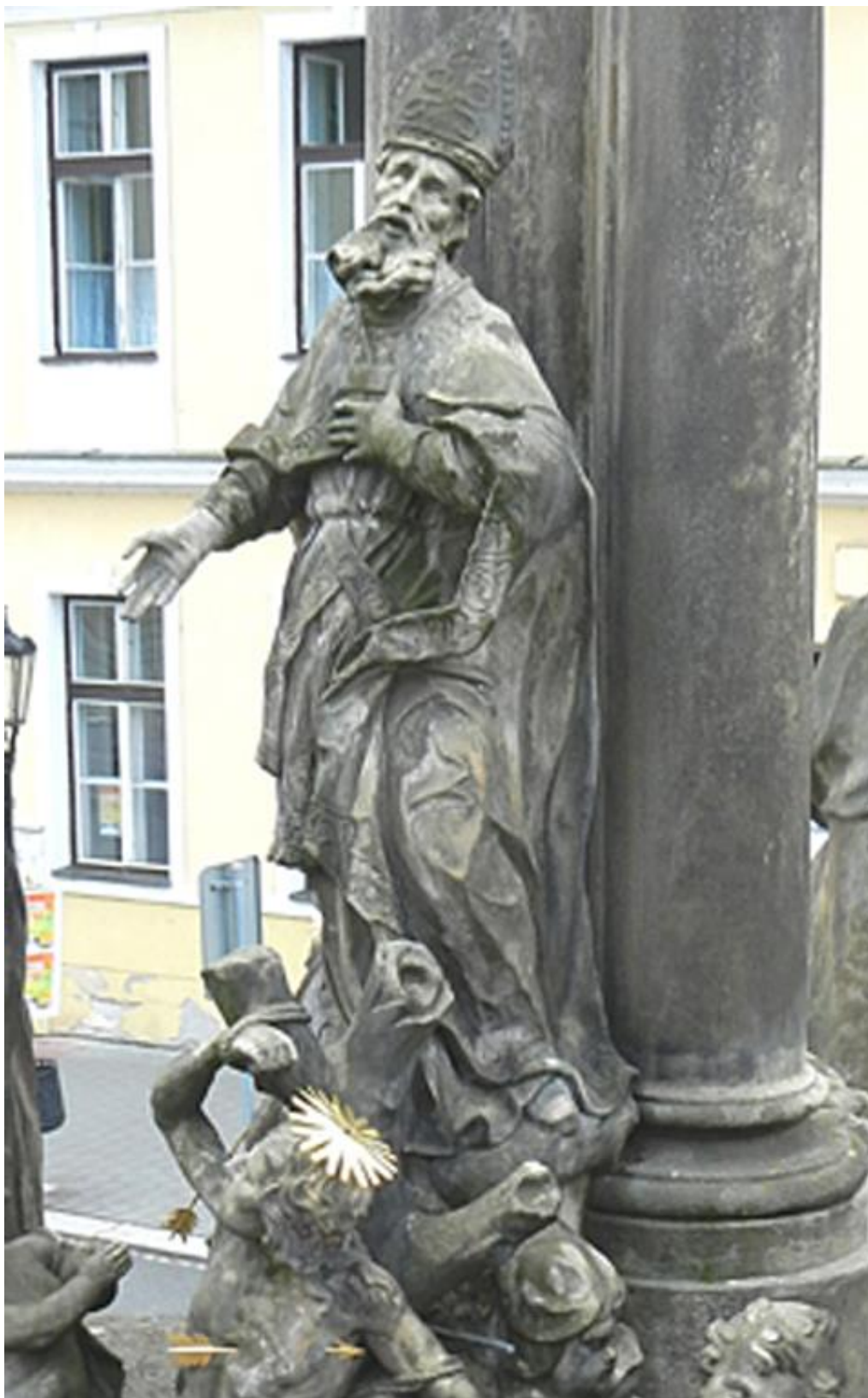
Kroměříž, sloup Nejsvětější Trojice, 2018 Socha sv. Wolfganga - stav před restaurováním.