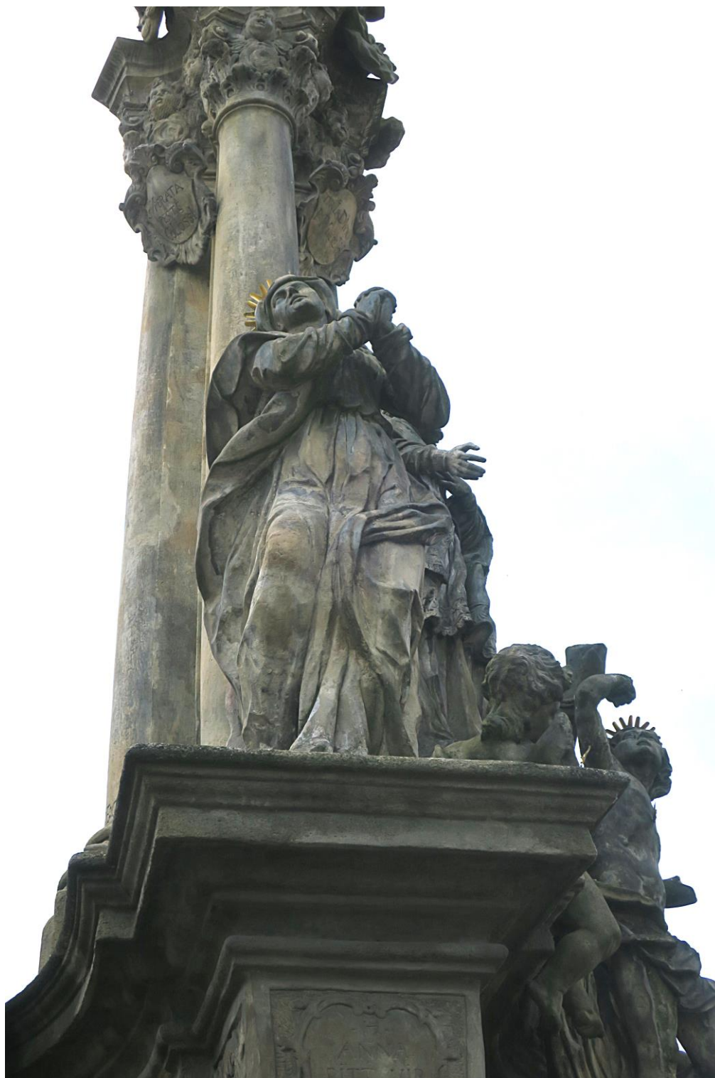
Kroměříž, sloup Nejsvětější Trojice, 2018

Socha sv. Anny na krycí římse soklu, vlevo, vzadu. Stav před zahájením prací.